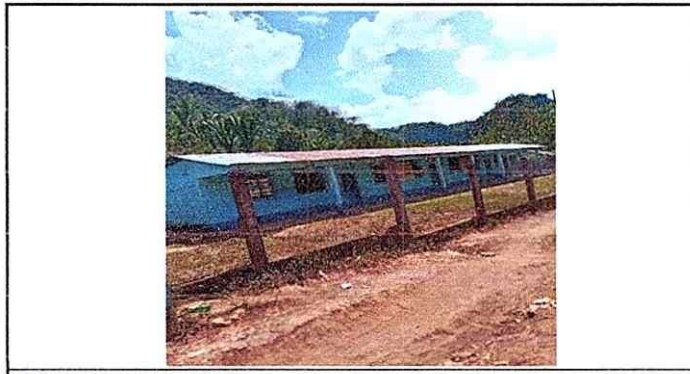
Mejoramiento del techo