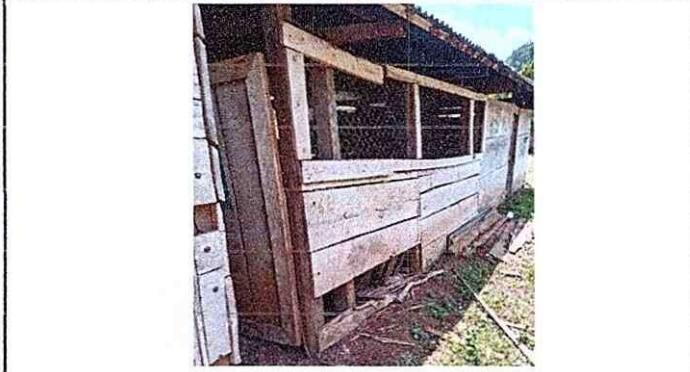
Ampliación de Cocina