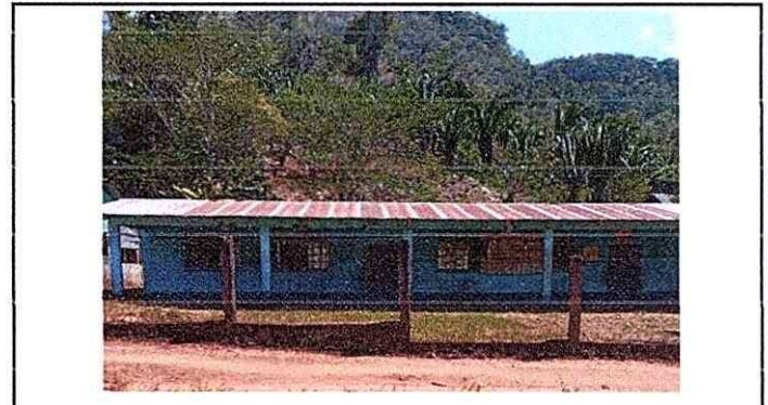
Cambio de lamina