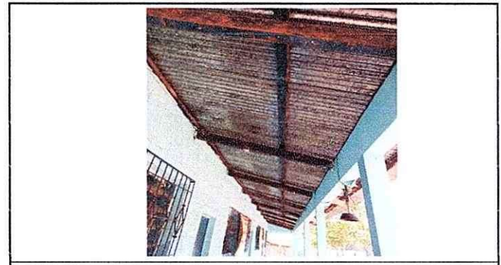
Cambio de costaneras

Observación: Si es necesario se pueden agregar hojas adicionales en el número de hojas.